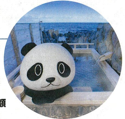
和歌山観光PRシンボルキャラクターわかば