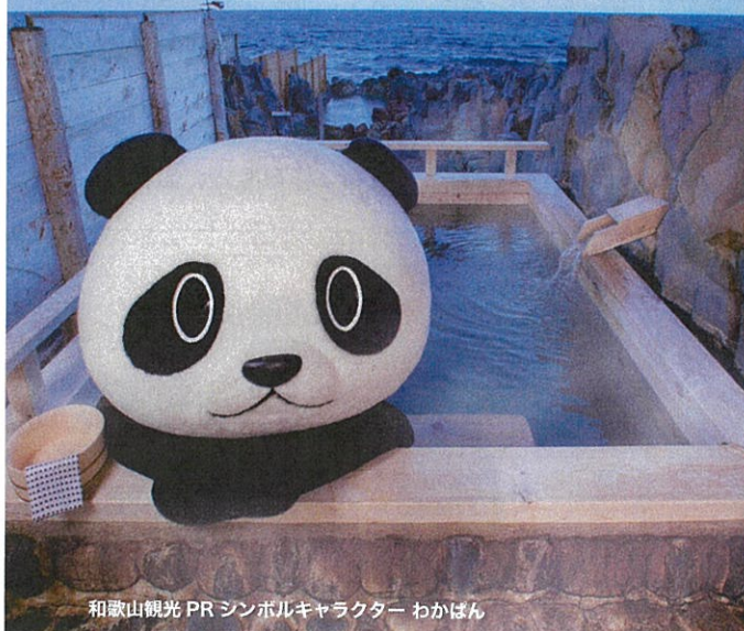
和歌山観光 PR シンボルキャラクター わかぼん